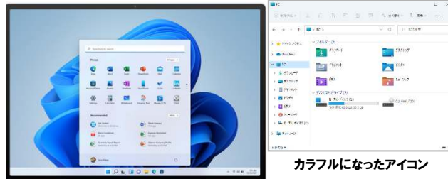
スタートボタンが画面の中央に！

まず大きな変化としては、スタートボタンとスタートメニューの位置が、左から中央に移動している点です。全体的に画面がシンプルになっており、操作性も向上しているようです。もちろん最初はある程度慣れは必要になってくると思いますが、使いやすくなっていることを期待したいところです。