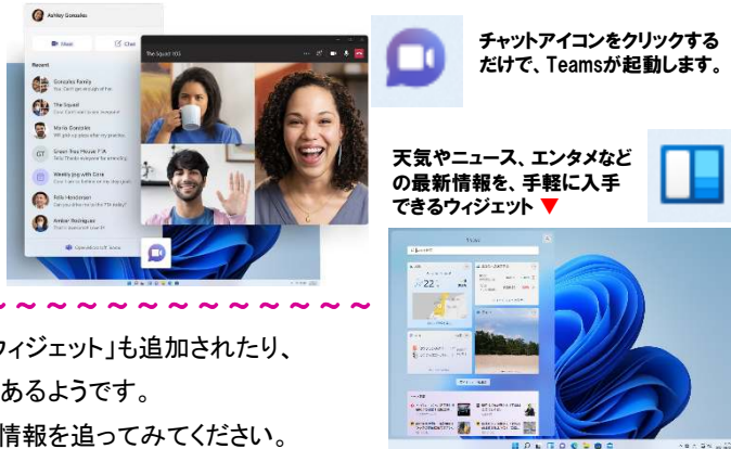
チャットアイコンをクリックするだけで、Teamsが起動します。

Teamsとは、Microsoftが提供しているコミュニケーションアプリで、チャットやファイル共有、ビデオ会議などができるツールです。企業を中心にシェアも高く、操作性なども高く評価されています。このTeamsがWindows11では標準で搭載されています。これまでTeamsを使ったことがない人でも簡単にTeamsが使えるようになります。